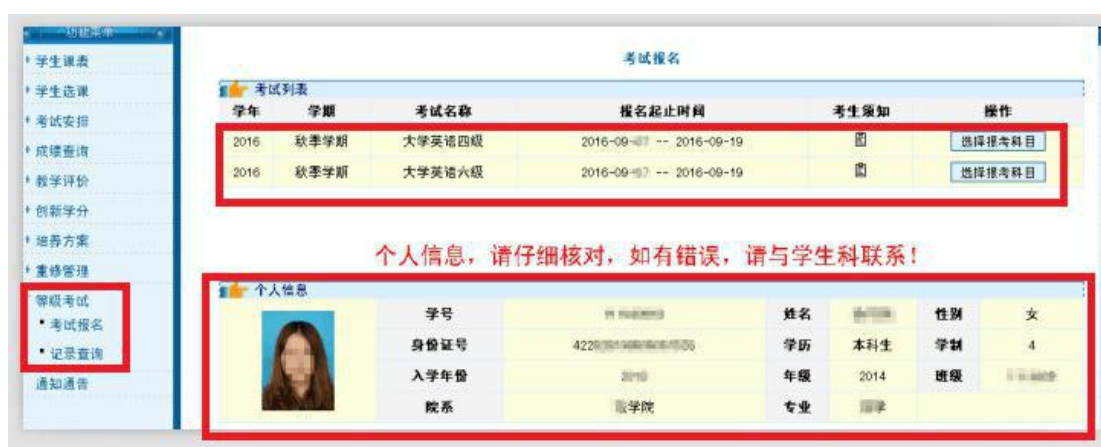
图 1.1 等级考试

用户名为学号，初始密码为身份证后八位，角色为学生，选择“等级考试”下的子菜单“考试报名”——阅读“考生须知”——“选择报考科目”